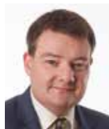
Magni Laksáfoss (B)